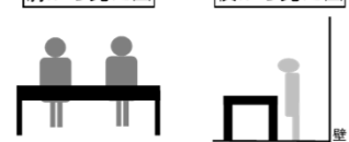
前から見た図 横から見た図

※各小間の背面は、壁面もしくはパーティションとなります。壁面には養生の上からポスターを張ることが可能。直貼り不可。フック等を使用してパネルを掲示する場合には、お申込時に必ずその旨ご記入ください。